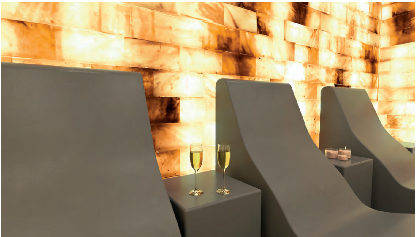
SPA COMFORT FURNITURE